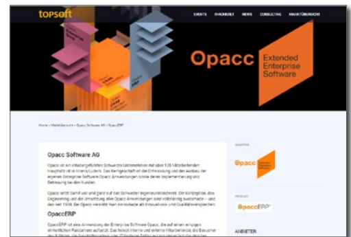
Umfassende Anbieter- und Produktinformationen